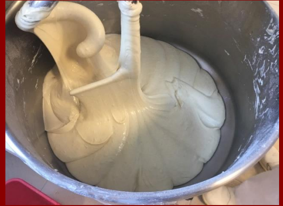
La technique des empois