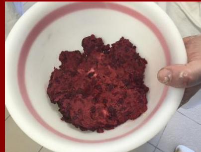
La tourte auvergnate